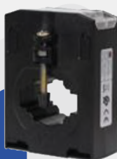
TRANSFORMADOR DE CORRIENTE TD6 200/5A - 400/5A