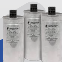
CONDENSADORES TUBULARES M ONOFÁSICOS