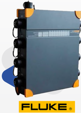
CALIDAD DE ENERGÍA Fluke 1760