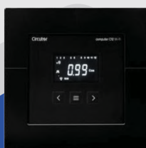
COMPUTER C12 WI-FI