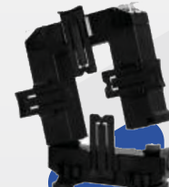
TRANSFORMADOR DE CORRIENTE TQ-10 1500/5 A