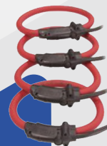
SENSORES FLEXIBLES PARA EQUIPOS FLEX FLEX-MAG120