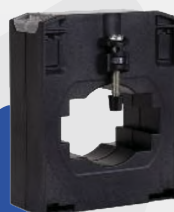
TRANSFORMADOR DE CORRIENTE TD8A 600/5 A 800/5 a 1000/5A