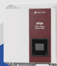
FILTRO DE ARMÓNICOS ACTIVO